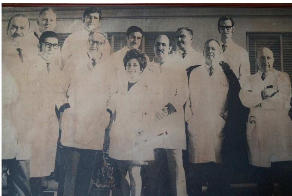
Primeros médicos del hospital de Quilpué