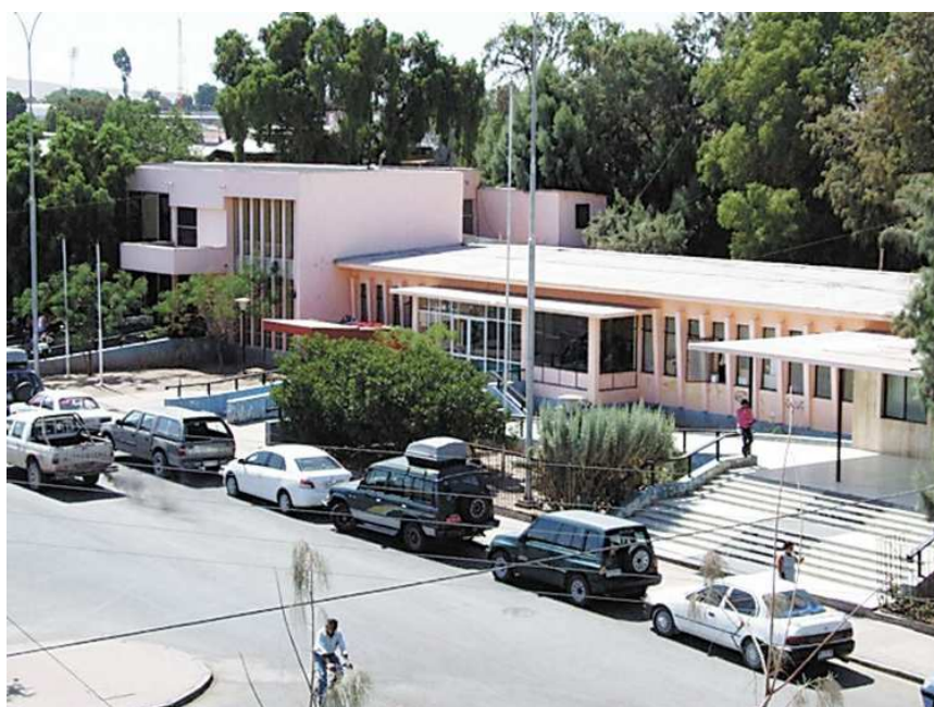
Vista Antiguo Hospital de Calama "DR. Carlos Cisternas".