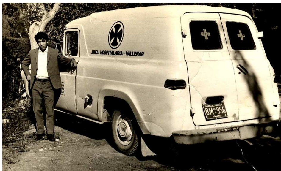
Ambulancia Hospital de Vallenar