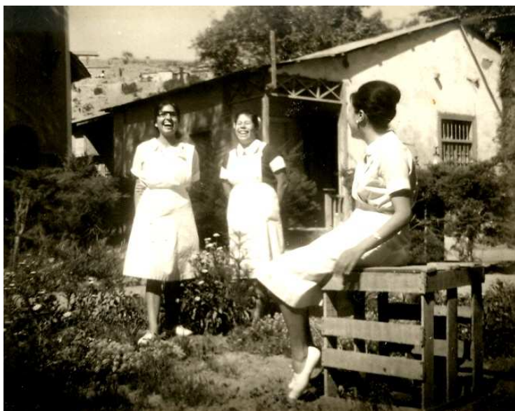
Personal de enfermería Hospital de Vallenar.