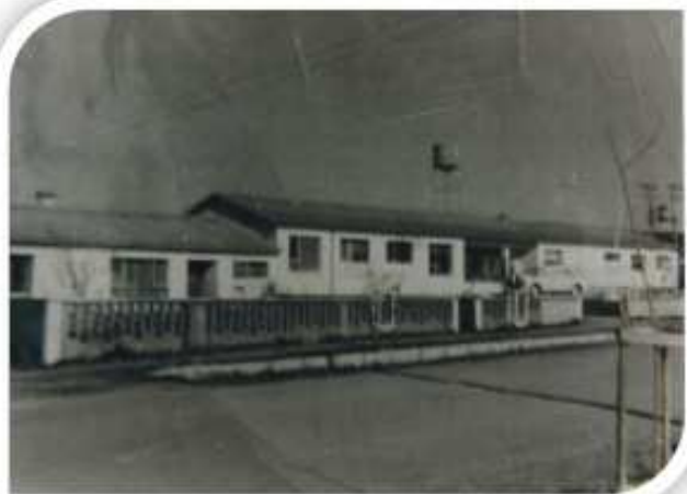
Hospital de Marchihue 1950