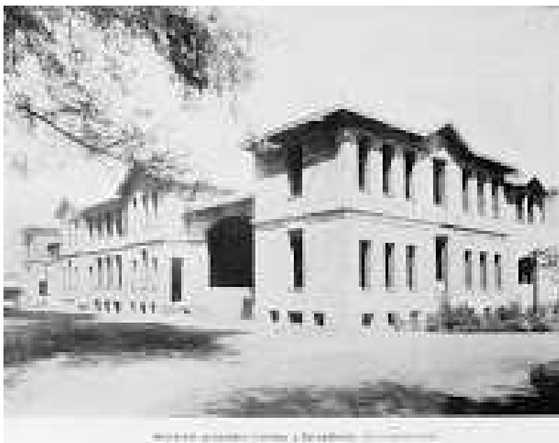
Hospital San Borja Arriarán , Edificio de Servicios Generales Gentileza Depto Comunicaciones y RRPP. Complejo Hospitalario San Borja Arriarán.