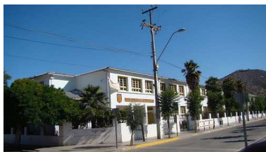
Hospital de Salamanca

Los Responsables de Patrimonio de los hospitales que conforman la Red del Servicio de Salud Coquimbo, todos los años, como es habitual, informan a la comunidad de salud y de las localidades donde se encuentran insertos, sus programas para la celebración del Día del Patrimonio Cultural de la Salud.