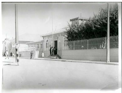
Frontis antiguo Hospital de Ovalle.