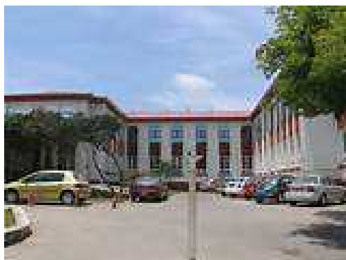
Hospital de La Serena