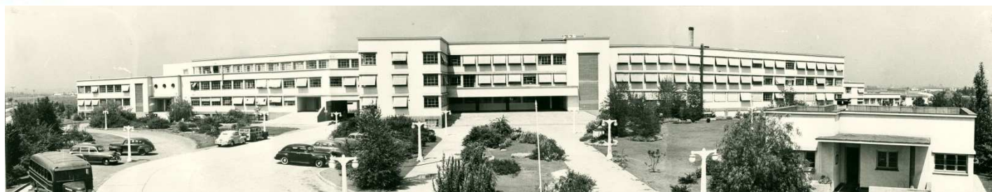
Panorámica actual ISP

El comité de Patrimonio Cultural del Instituto de Salud Pública, organizó para este año 2015, la realización de visitas guiadas al interior del recinto, para recibir al público que quiera conocer un poco más de la historia de esta institución, y de sus antecesores, en el Día Nacional del Patrimonio Cultural de la Salud, el domingo 31 de mayo entre las 10:00 hrs. Y 14:00 hrs.