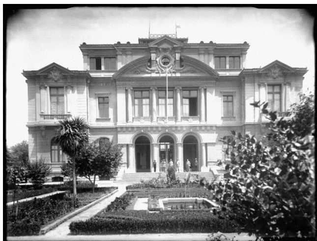
Instituto de Higiene