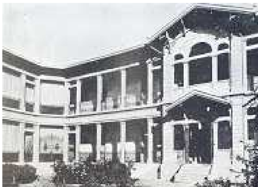
Policlínico y Fachada Norte, Hospital San Borja Arriarán.