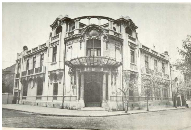
Instituto de Salud Ocupacional