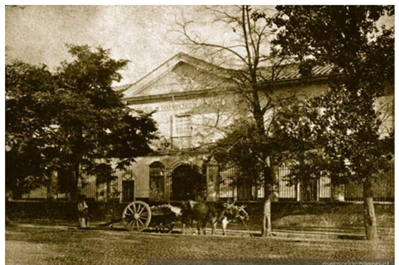
Hospital San Francisco de Borja. Fachada Antigua (1910).