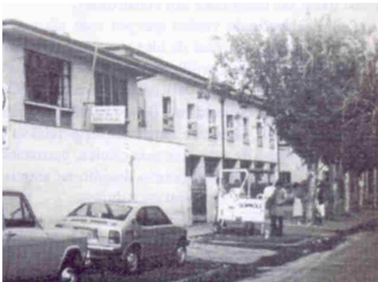
Frontis Hospital Exequiel González Cortés, década del 70.