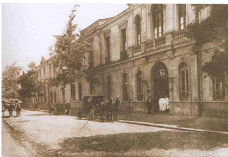
Frente Central de la Casa de Orates en la calle Olivos (1936).