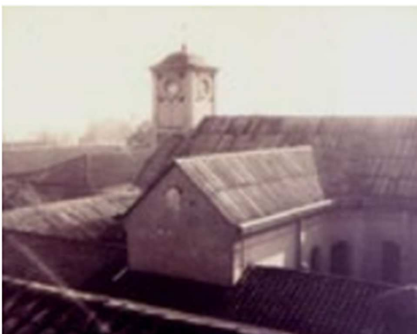
Vista de la Torre y naves de la Capilla del Hospital San Vicente de Paul. Archivo Unidad de Patrimonio MINSAL.