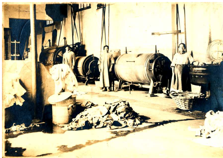
Lavandería Hospital de Niños de Valparaíso 1944.