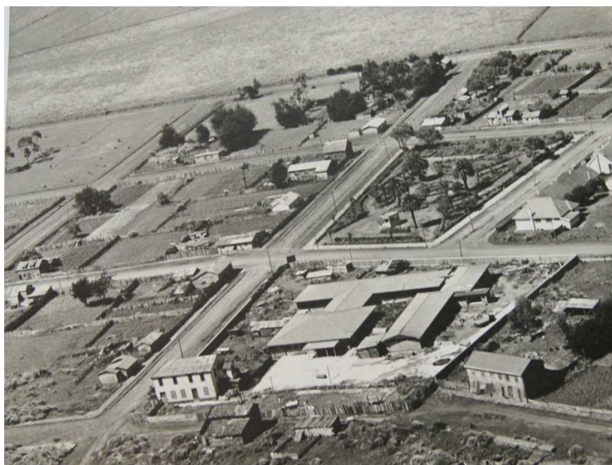
Vista aérea del Hospital de Puerto Saavedra en 1969.